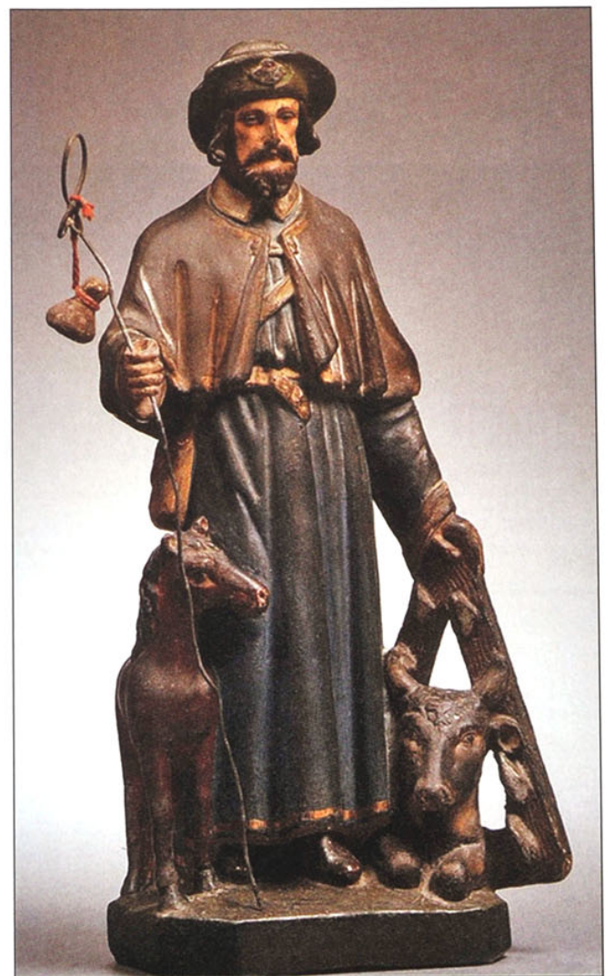
Oorspronkelijk beeld van de Heilige Guido te Anderlecht.