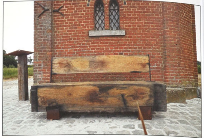
De eiken zitbank en infozuil.