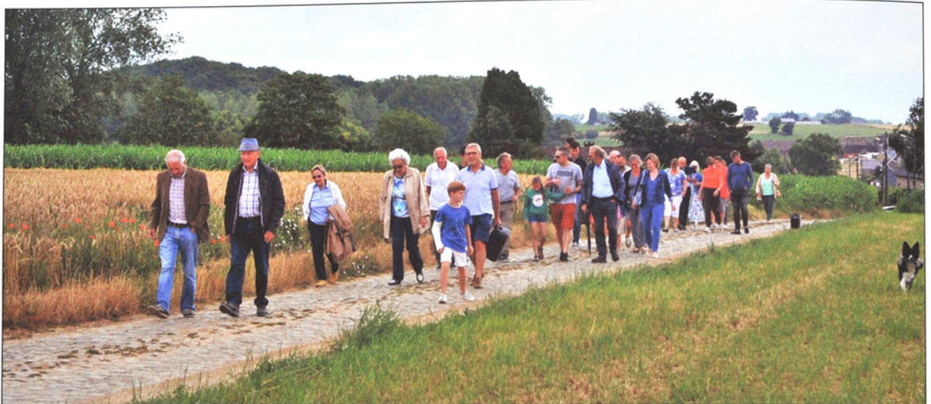
Viergatenaren en Kadonkelputters op weg naar de Viergatenkapel.

In voorgaand nummer 124 wordt op bladzijde 55 de geschiedenis van de Viergatenkapel beschreven. Er werd toen verwezen naar een feestelijke samenkomst op zaterdag 13 juli 2019 om 13 uur aan de bewuste kapel. Toen tijd en uur gekomen waren wandelde rond 12u30 een roedel Viergatenaren kapellewaarts. De jarenlang verwilderde omgeving werd kundig verfraaid met een originele eiken zitbank en een infopaal. Voor het eerst sinds vele jaren was de kapel nog eens open. Niet toevallig viel deze minifestiviteit samen met de tiende editie van ons Viergatenbuurtfeest. Om dit stukje erfgoed voor de toekomst te bewaren is er nog werk aan de kapel zowel aan binnen- en buitenkant. Met de begripvolle eigenaars werden afspraken gemaakt om de verdere restauratie van de kapel aan te vatten.