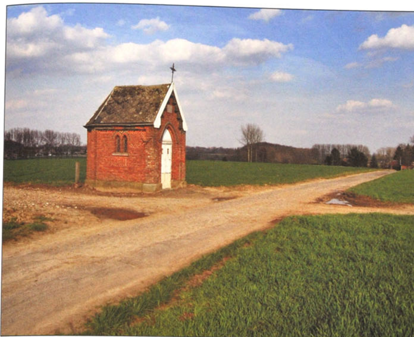
De kapel op het kruispunt van de Viergatenstraat met de Heykenweg.