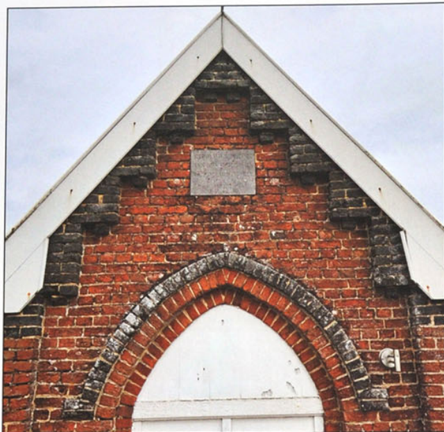
Voorgevel van de kapel.