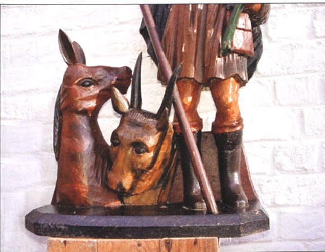
De Heilige Guido met aan zijn voeten een paardenkop en een ossenkop.