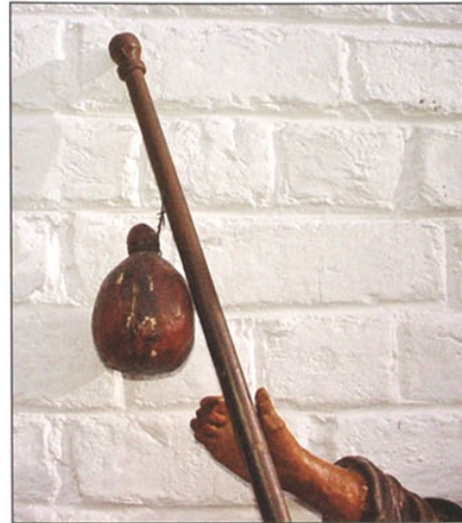
Detail van het beeld: de kalebas, de gedroogde schil van de vrucht, die dient als kruik of drinkbeker.