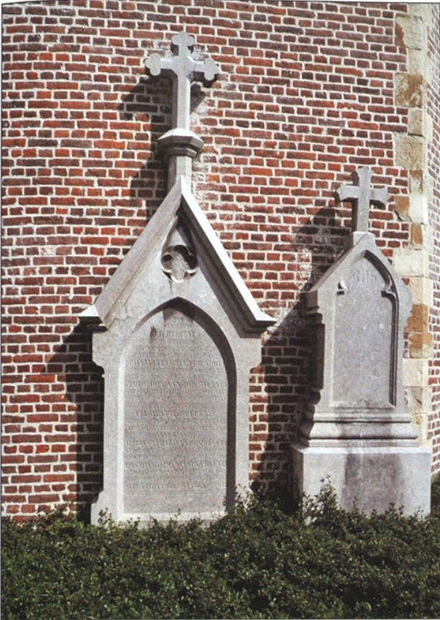
Grafkelder van de families De Leener en Van Den Heuvel te Oetingen tegen de kerkmuur aan de oostkant.

parochie Oetingen. Ze behoorden tot de leidende gelovige notabelen van de parochie.