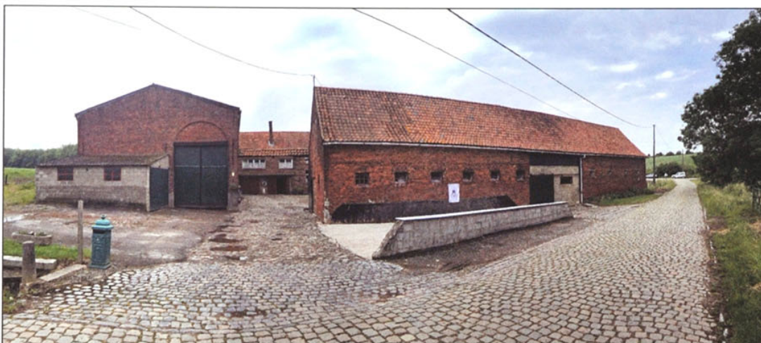
't Hof Van Den Heuvel in de Schavolliestraat.