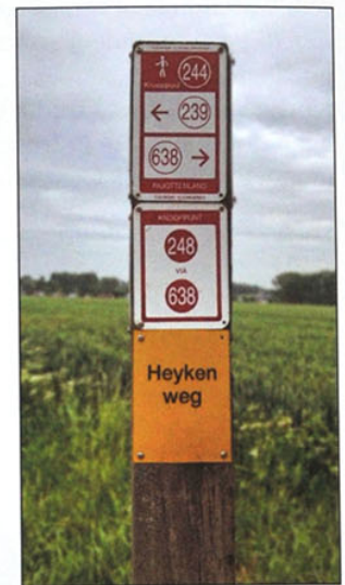
Het paaltje van wandelknooppunt 244 en de aanduiding Heykenweg.

Dit zinnetje schrijvend was het maandag 1 april 2019 en ik hoed me dus voor valstrikken. Mijn dagblad maakt melding van een update van de Belgische Vereniging van Pensioenverenigingen . Die oude wijn in een nieuw vat heet voortaan PensioPlus (Pensio+). Organisaties en producten met een plus zijn hot. De parel van het Pajottenland verdient zeker dit predikaat. Met de droom van een zitbank aan ons kapelleke Viergaten kwamen we terecht bij Pajottenland Plus, een organisatie die ijvert voor plattelandswerking. De weg die loopt naar