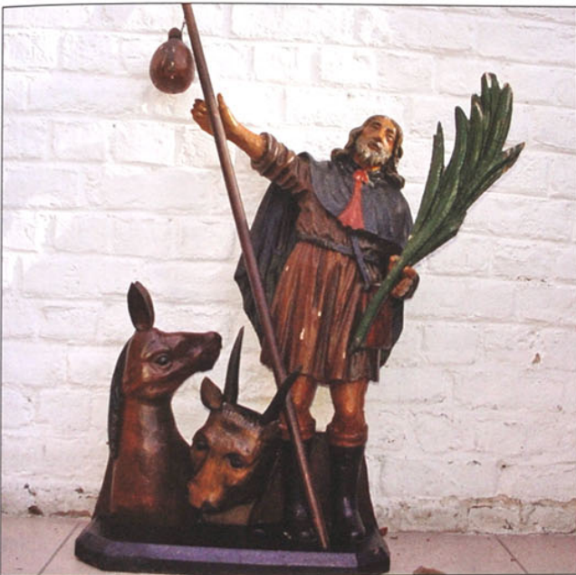
Oorspronkelijk polychroom beeld van de heilige Guido dat op het altaar stond in de Viergatenkapel.

GEBOUWD TER EERE VAN DEN H. GUIDO EN DE H. MAAGD MARIA 1886