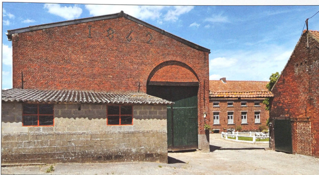
Datum 1862 op de voorgevel van de schuur van 't hof Van Den Heuvel.