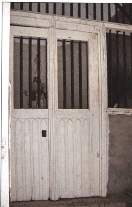
Scheidingsdeur tussen voorportaal en altaar.

Het concept van de kapel is klassiek: een dubbele voordeur onderaan uit hout, een bovendeel met ijzeren staven waarboven een vast houten deel in gotische vorm met daarboven een zwarte siersteen. De bakstenen zijn rood egaal en van een speciaal klein formaat (17,5 x 8,5 x 5 cm). De zwarte