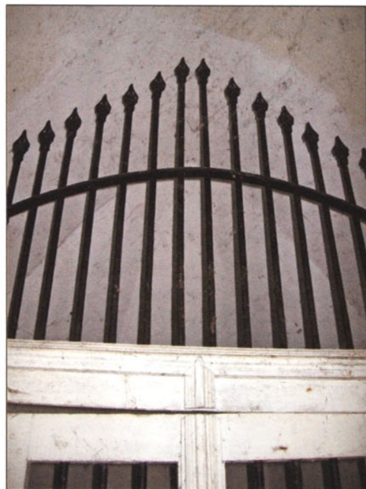
Een detail van dezelfde scheidingsdeur.

De volkse naam Kapelleke Hinnengat werd gegeven omdat mensen er kwamen bidden tegen de onwetende kip-