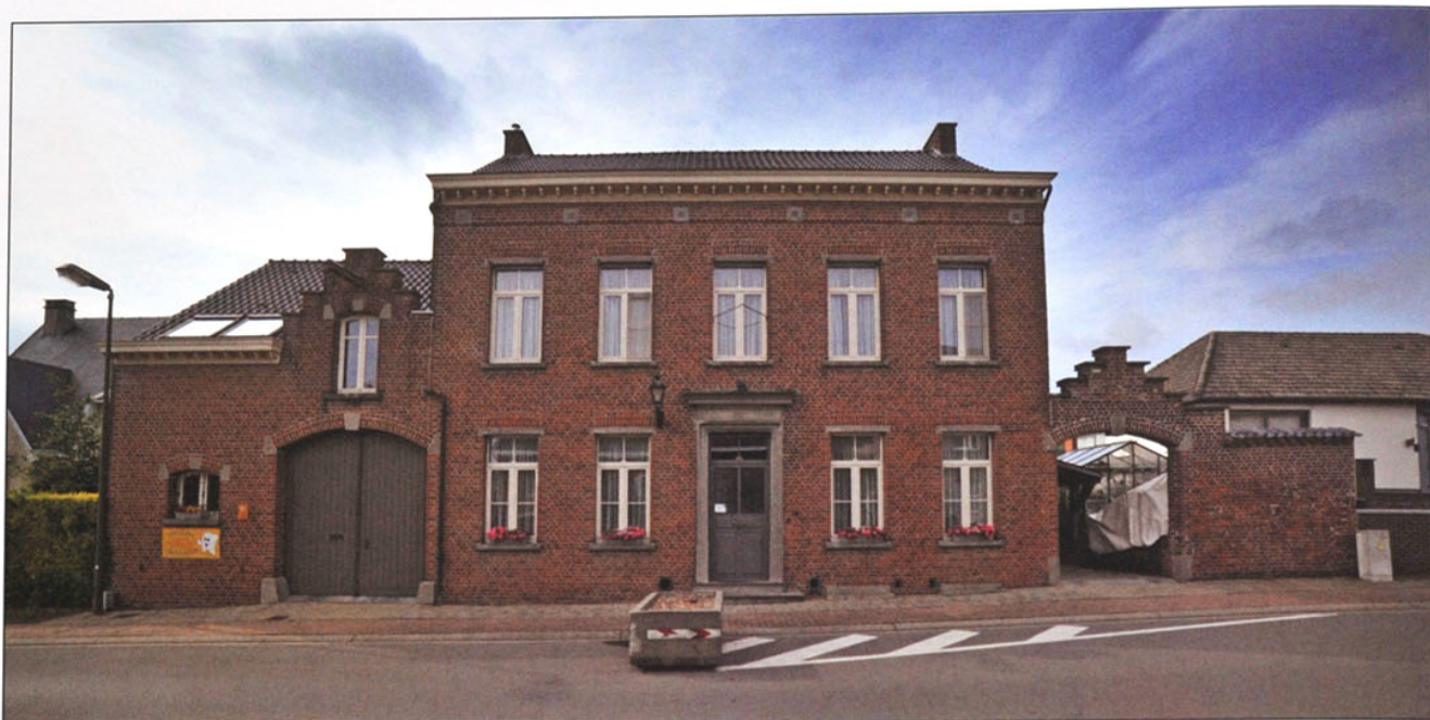
Hierboven een foto van de dokterswoning in de Kerkstraat.