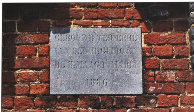
Detail van de arduinen steen in de kapelnok.