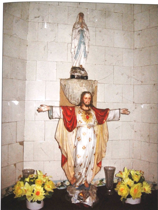
Op het altaar het beeld van het Heilig Hart en erboven de beeltenis van onze Lieve Vrouw.