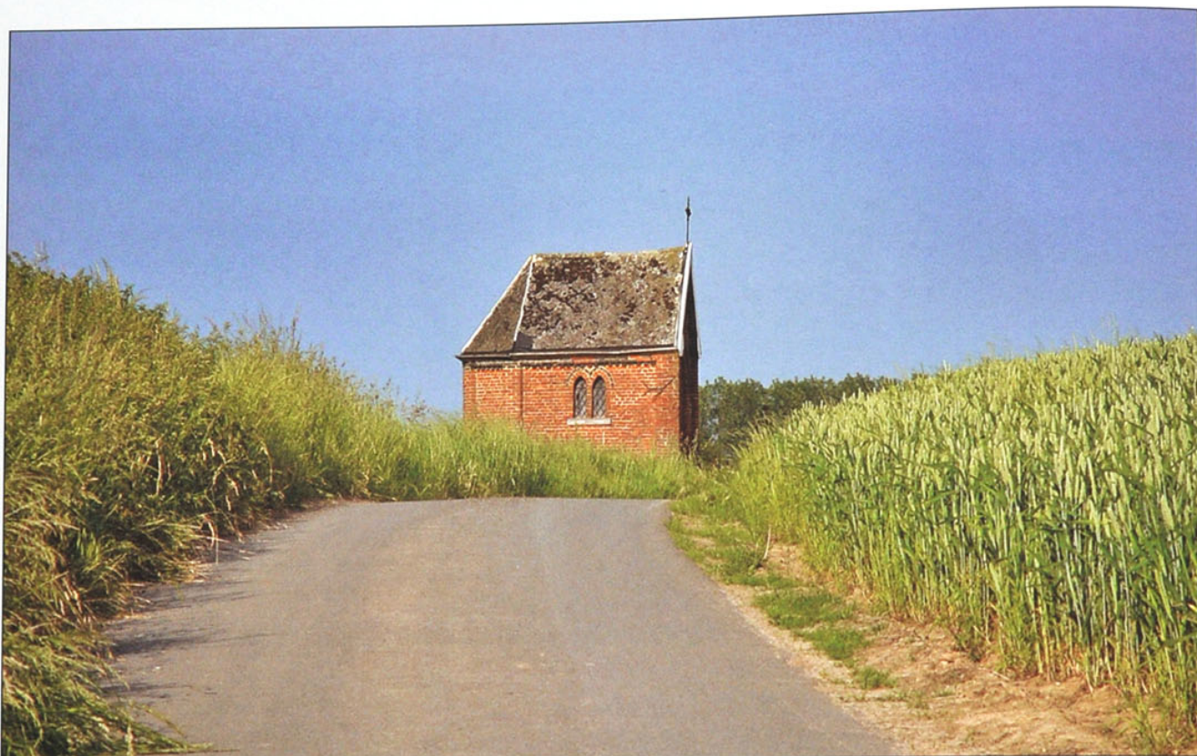
Zicht op de kapel bij het inrijden van de Viergatenstraat vanuit het Oosten.

pen die windeieren legden. Een windei is een ei zonder eischaal en een hinne (een hen) is dialect voor een kip. De kapel was een ook toevluchtsoord voor bevallingen, kalvingen, dreigende epidemieën, gezondheidsperikelen, het bekomen van gunsten, het verwerken en voorkomen van tegenslagen. De kapel werd zowaar een klein bedevaartsoord. Gelovigen uit Denderwindeke maakten de tocht met de tram tot aan café 't Snepken en trokken dan te voet naar de kapel. Zo ook de mensen van de wijk Goteringen en omgeving.